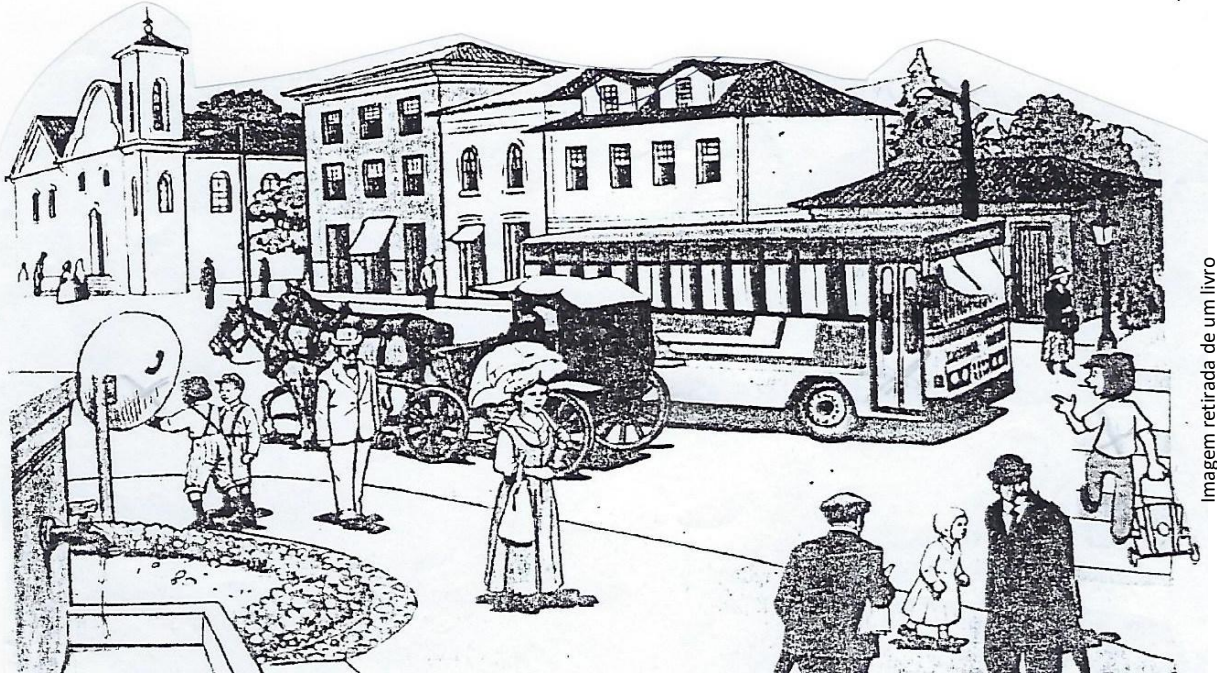
Imagem retirada de um livro

5) Observe o desenho abaixo e marque cinco erros ocorridos na cena de uma cidade do século XIX(19)